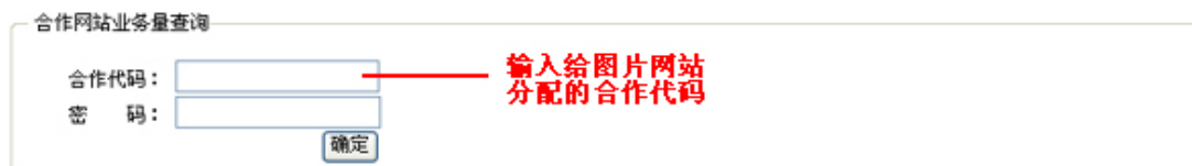
图4 业务量查询界面

图片网站可以到彩信精灵网上查询其网站的彩信发送量。在彩信精灵网的“网站合作”栏目中进行查询。也可直接输入网址 http://www.cai139.com/coop.htm 进入。查询界面如图 4 所示。